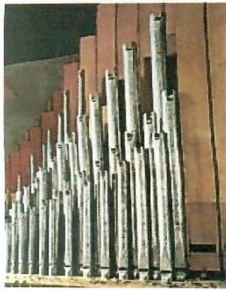
gelrenovierung in der Stadtpfarrkirche Wels